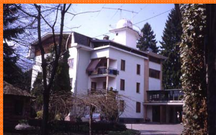
Sede del seminario 26-27 settembre: CASA DEL COE via Milano, 4 Barzio (Lc)

Il prossimo Seminario su Malattie Tropicali "MALARIA" si svolgerà il 14 novembre 2009 a Milano in via Copernico, 5.